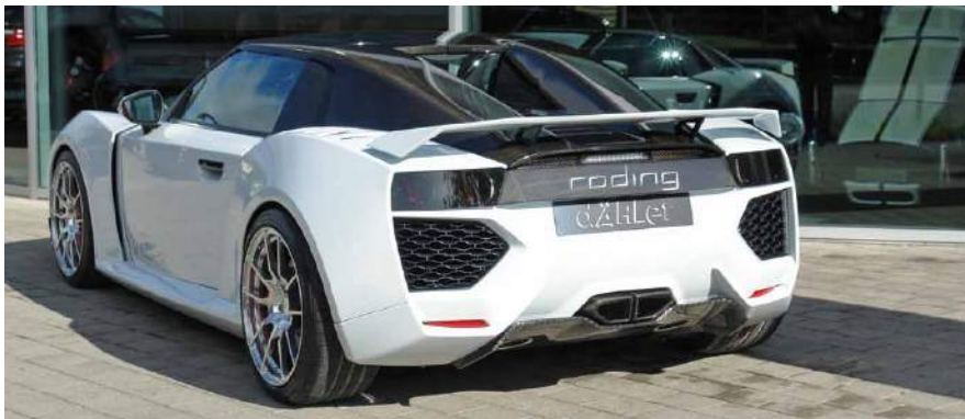
Roding Roadster R1 in der Ausführung als «dÄHler competition line»

Das Rad mit seinem passenden Reifen ist die einzige Verbindung Ihres Roding Roadster R1 zur Strasse – deshalb in Kombination lebenswichtig.