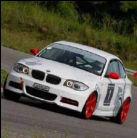
«dÄHLer race line» 03