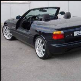
«dÄHLer classic line» 02