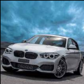
«dÄHLer competition line» 01